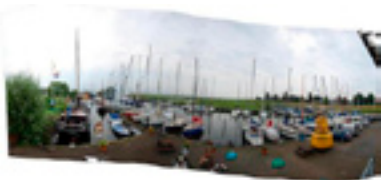
Jachthaven Den Bommel

in het bezoekerscentrum. Het eiland is alleen via een pont of boot te bereiken