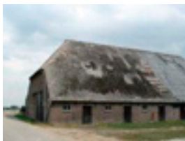
Verlaten boerderij op Tiengemeten

Hij wilde naar het eiland Tiengemeten om daarna door te varen naar Den Bommel voor de nacht. De volgende ochtend was Jaap al vroeg op en liep rustig met zijn spullen richting douches en wij volgden zijn voorbeeld al gauw. Zodra het ontbijt klaar stond werd er gebeden voor het eten en een veilige vaart. Jaap las nog een dagoverdenking voor en we begonnen met het ontbijt. Bij aankomst op Tiengemeten keken we onze ogen uit naar al het moois wat daar te zien was en genoten van de rust die het eiland uitstraalt.