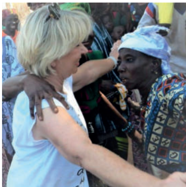
Afscheid nemen is niet eenvoudig

Ps.: Natuurlijk informeren wij u met het verdere verloop in de nieuwsbrief in juni 2021.