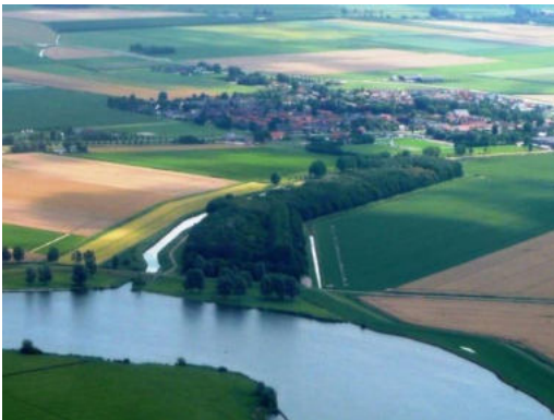
Het bos van Piershil

Tot zover het verhaal over het wapen van Piershil en zijn geschiedenis.