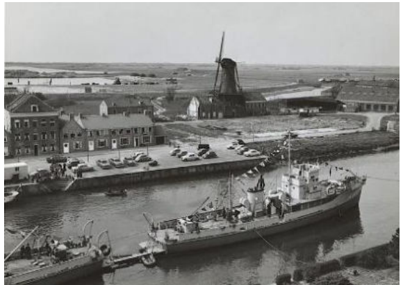
Marine Hellevoetsluis 1950-1960

De vesting was in die tijd belangrijk als (marine)haven en tot in de 19e eeuw bleef deze positie gehandhaafd. Doordat rond 1830 het Kanaal door Voorne werd gegraven was er een levendige handel en doorvaart naar Rotterdam, daarnaast had Hellevoetsluis verschillende marine-instellingen en opleidingsinstituten en een vestingartillerie. Er werden in deze tijd verschillende militaire oefeningen met land en zeemacht gehouden in Hellevoetsluis en omstreken.