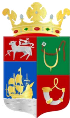
Het wapen van Hellevoetsluis (sinds 1961)**