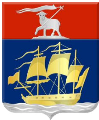
Het wapen van Hellevoetsluis (1816 - 1961) *