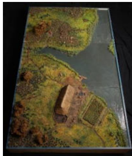
Maquette boerderij uit de IJzertijd op Voorne-Putten Werner Kannamüller - museum Rotterdam

De oudste resten van bewoning in het huidige grondgebied van Spijkenisse, stammen uit \pm 2.900-1.800 v. Chr. Ze zijn gevonden in de voormalige polder Vriesland. Het gaat om enkele kleine woonplekken op de oever van een verdwenen kreek. Na 1.800 v. Chr. werd het gebied een moeras en onbewoonbaar.