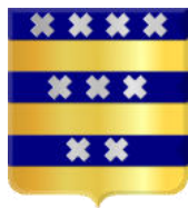
Het wapen van 1936