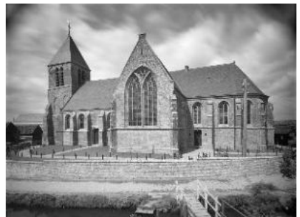
Dorpskerk voltooid in 1521

Al in de 13e eeuw waren de Spijkenissers begonnen met het bouwen van een stenen toren bij hun houten kapel, op de plek van de huidige Dorpskerk. In 1304 kwam de eerste kerkklok daarin te hangen. Wellicht was deze klok een hulde van heer Nicolaas III van Putten voor het aandeel van Spijkenissers in de oorlog die hij dat jaar voerde.