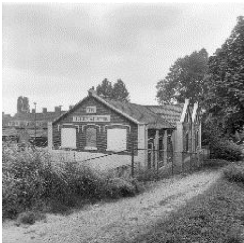
Leeuw van Putten (in 1988)

Stoomgemaal "De Leeuw van Putten" In 1891 werd het stoomgemaal "De Leeuw van Putten" voltooid. Het verving de vele windmolens die het overtollige polderwater van de Vierambachtenboezem naar de haven pompten.