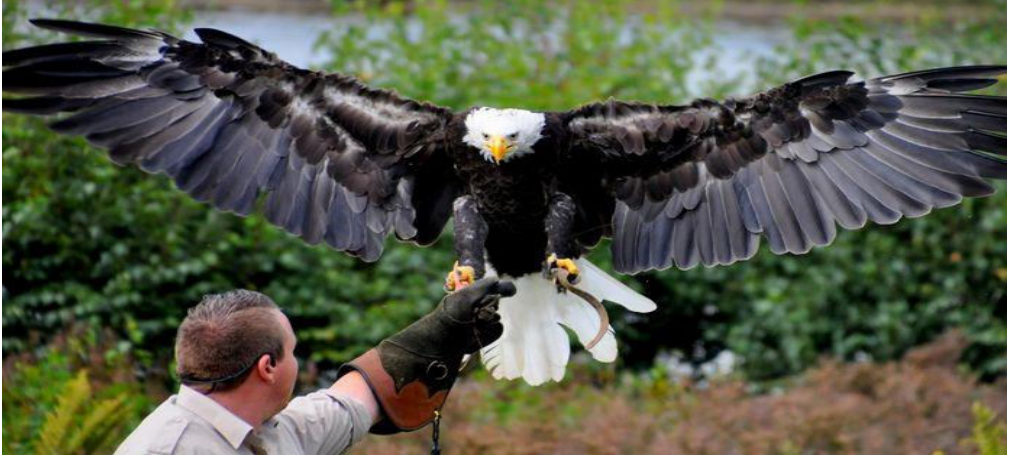
Hier kan je goed zien hoe groot de zeearend eigenlijk is

worden gesignaleerd? Dat in de Nieuwe Waterweg ook veel bruinvissen zwemmen?. Dat er elk jaar op de Ring van Zuidland zeven ransuilen in een boom zitten?. Dat Voorne-Putten een oase is voor brandganzen, grauwe ganzen (40 jaar geleden uiterst zeldzaam in Nederland), Canadese ganzen, rotganzen etc? . Inmiddels doe ik ook al jaren aan de vogeltelling mee, , hangen in mijn tuin vier vogelhuisjes (tot groot plezier van alle poezen) en heb