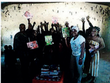
Overhandigen van de schoolboeken