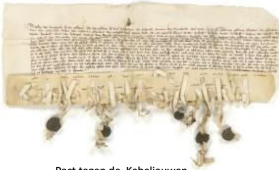
Pact tegen de Kabeljauwen

Willem V, die op dat moment pas 13 jaar is. Dat gebeurt in 1349. De steden beloven Margaretha in ruil voor de machtsoverdracht een flinke som geld.