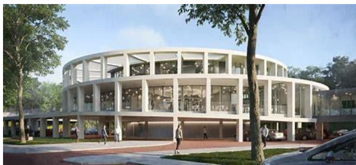
Nieuwe gemeentehuis Albrandswaard

Albrandswaard is in 1985 ontstaan door het samenvoegen van de gemeentes Rhoon en Poortugaal. Hierbij werd een gedeelte van het Poortugaals grondgebied afgestaan aan Rotterdam; dit maakt deel uit van het Rotterdamse stadsdeel Hoogvliet. De gemeente telt 25.853 inwoners (per 1 juli 2021, bron: CBS) en heeft een oppervlakte van 22,72 km 2 . Veel inwoners zijn forensen die in Rotterdam werken. Het gemeentehuis bevindt zich sinds het najaar van 2006 in een kantorencomplex aan de Hofhoek in Poortugaal. Voorheen stond het aan de Viaductweg in Rhoon. In oktober 2021 is een nieuw gemeentehuis in Rhoon in gebruik genomen, in het zogeheten Huis van Albrandswaard nabij het metrostation en de de porthal aan de Stationsstraat.