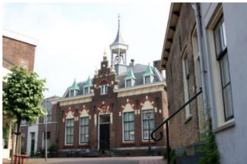
Voormalig gemeentehuis Poortugaal

Poortugaal is tot eind 1984 een zelfstandige gemeente gebleven. In dat jaar fuseerde Poortugaal met Rhoon tot de gemeente Albrandswaard.