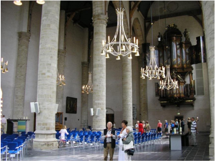
Geen houten banken maar mooie blauwe stoeltjes

Wij gaan zingen in de Nieuwe Kerk. Ik begon mijn verhaal over de houten banken in de dorpskerk. Laat nu in 2001 de houten banken in de Nieuwe Kerk vervangen zijn door losse blauwe stoelen. Aangepast aan multifunctioneel gebruik, precies waarvoor ik opteer in de dorpskerk. Toch benieuwd hoe dat eruitziet. Voor liefhebbers van zeehelden, het praalgraf van de broers Cornelis en Jan Evertsen, trouwe secondanten van die andere Zeeuw Michiel de Ruyter, is in de kerk te bewonderen. Het praalgraf werd in 1816 verplaatst vanwege de sloop van de Noordmonsterkerk naar de Nieuwe Kerk.