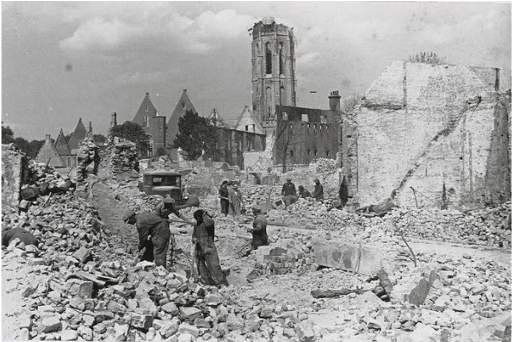
De verwoeste Abdijkerk in Middelburg in mei 1940

kerktorens (bij benadering) weet. Laat de 'Lange Jan', ofwel de abdijtoren, nu net op plaats 11 komen met, voor de liefhebbers, een hoogte van 90.4 m. Overal op Walcheren is de toren, samen met de vuurtoren van Westkapelle te zien. Nu de kanonnen weer onzinnig bulderen in Cherson, Marioepol en de voorsteden van Kiew gaan mijn gedachten ook weer terug naar 'De slag om de Schelde'. In de vorige editie van 'Randverschijnselen' heb ik hierover verteld. Middelburg werd op 17 mei 1940 gebombardeerd door de Duitsers en Fransen. Het stadhuis en het Abdijcomplex, waaronder de toren, werden zwaar beschadigd. De herstelwerkzaamheden begonnen reeds in 1941 en duurden vele jaren. Middelburg is weer helemaal hersteld en de binnenstad is weer een pareltje. De 'Lange Jan' staat tussen twee kerken in, de Koorkerk en de Nieuwe Kerk.