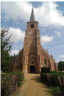
Dorpskerk aan de Groene Kruisweg

De variant waarop het wapen van Poortugaal is gebaseerd, had de rode zoom met gouden burchten erin nog niet, waarmee het meer oogt als het wapen dat Alfons III gebruikte. De zoom werd in de 14e eeuw toegevoegd en in de 15e eeuw werd het aantal burchten vast gesteld op zeven. Het wapen van Poortugaal heeft deze zoom niet, hierdoor wordt vermoed dat dit wapen al in gebruik was voordat Alfons III het zijne in 1245 in gebruik nam.