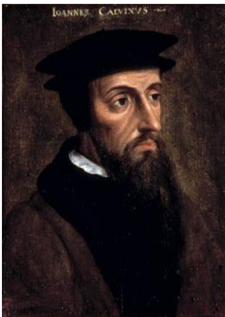
De sombere Calvin

Ik weet niet hoe jullie de overgang van de Kern naar de Dorpskerk hebben ervaren, voor mij was het wennen. Alles heeft zijn voor- en nadelen, om maar eens even een open deur in te trappen. Laat ik maar eens beginnen over de nadelen van onze nieuwe stek...de houten banken...zucht. Wat moeten kerkgangers eigenlijk lijden op die houten banken. Bij de Rooms-Katholieken in de middeleeuwen was het al sober, maar na de Reformatie werd het voor de kerkgangers niet gemakkelijker. Als ik aan de reformatie denk valt al snel de naam van Johannes Calvin (1509-1564). Als ik dat lijdzame gezicht van Calvin zo eens bekijk dan lijkt het mij dat hij geen humorvolle man was. Toch maar