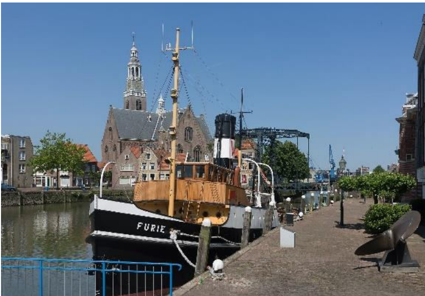
De Furie