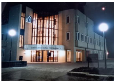
Het nieuwe kantoor aan de Aveling

We hebben niet lang gebruik gemaakt van de kantoorruimte aan de Botersloot. Er werd door de directie besloten om een kantoor te laten bouwen in de wijk Zalmpaat aan de Aveling. Reden hiervan was, om wat dichterbij de huurder te staan gezien de ontwikkeling van de Zalmpaat, Middengebied en later kwam daar ook nog Boomgaardshoek bij.