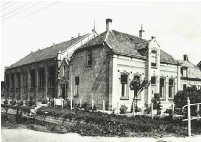
Oude gereformeerde kerk met de barakken

de bouw begonnen. Voordat de kerk klaar was, hebben de dolerenden elf weken van de vlasschuur gebruik gemaakt.