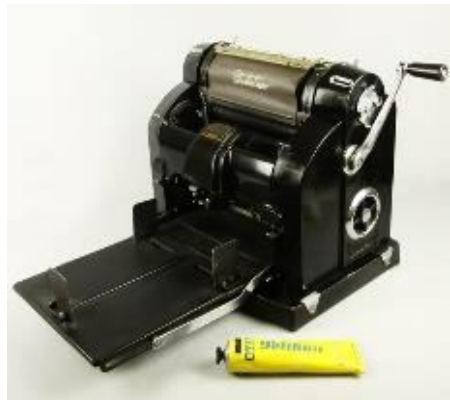
Gestetner Rotary stencilmachine

De jaarlijkse huurverhoging werd door mij ook op te typemachine uitgetypt, en daar er nog een kopieermachine was, stond ik aan het wiel te draaien van de stencilmachine. Die stond in de kelder van het kantoor.