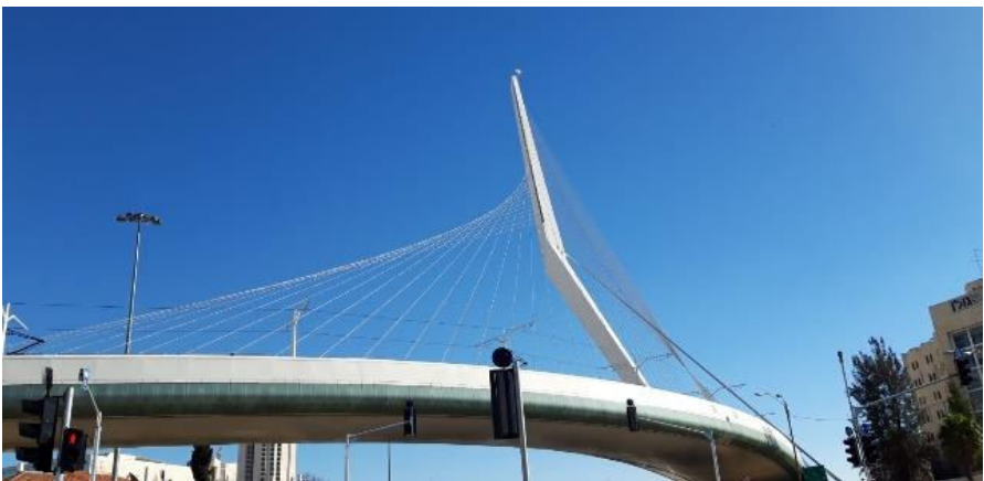
De Snarenbrug in Jeruzalem

En toen ik in 2019 in Israël was met Sing-In Israëlreis van Arjan, verbleven we o.a. in het Jerusalem Gate Hotel in Jeruzalem, en vanuit mijn kamer keek ik uit op de Snarenbrug. Die wordt ook vergeleken met de Erasmusbrug