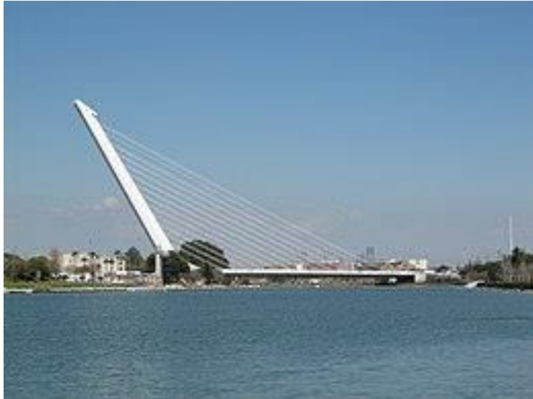
De Alamillobrug overdag

Een andere brug die ook met de Erasmusbrug wordt vergeleken is de De Alamillobrug een tuibrug overde Guadalquivir in Sevilla, Spanje. Santiago Calatrava maakte het ontwerp voor de brug. Calatrava's Sundial Bridge in Redding, Verenigde Staten (2004), de Erasmusbrug in Rotterdam (1996), en de Snarenbrug in Jeruzalem, Israël (2008), hebben een vergelijkbaar ontwerp.