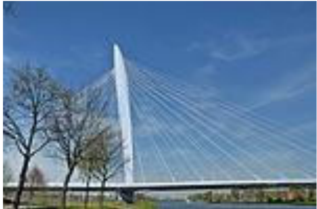
De Prins Clausbrug

Zoals gebruikelijk haal ik informatie bij Wikipedia vandaan. Ook van de Erasmusbrug. Wat leuk is te vermelden, dat er vergelijkbare bruggen zijn. Zoals de Prins Clausbrug in Utrecht.