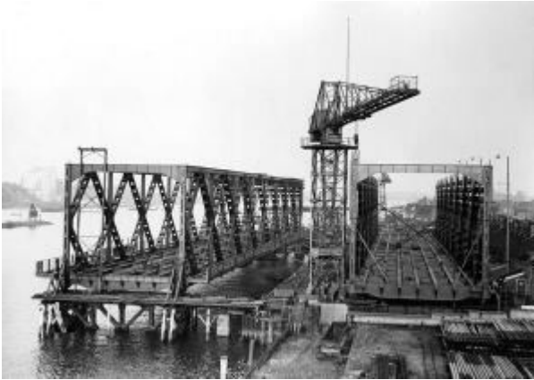
Bouw Moerdijkbrug 1935; Bron: https://beeldbank.rws.nl , Rijkswaterstaat Afdeling Multimedia Rijkswaterstaat

overspanningen van elk circa honderd meter lang, hoewel deze brug met tien overspanningen wel korter was dan de spoorbrug met tien overspanningen. Het was een vakwerkbrug en destijds één van de grootste bruggen van Europa.