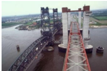
Oud en Nieuw