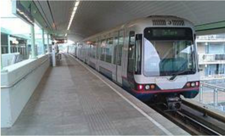
Het Rotterdamse metrostation De Akkers is het eindpunt

Achter het station liggen vier aan elkaar gekoppelde opstelsporen, waar 's nachts metro's gestald worden. Aan het eind van deze opstelsporen staan sinds 2002 twee grote walvisstaarten die symbolisch het einde van het gecombineerde metrotraject van lijn C en D aanduiden. Het uiteinde ligt op ongeveer 500 meter van het station in het Vogelenzangpark. Oorspronkelijk waren achter beide sporen vrij liggende uitloopsporen van 300 meter lengte aanwezig. In het kader van de bouw van de Beneluxlijn (metrolijn C) zijn deze verlengd tot de huidige lengte.