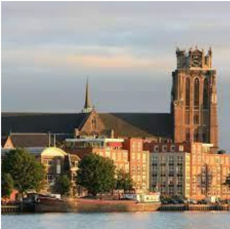
Grote of Onze-Lieve-Vrouwe Kerk Dordrecht