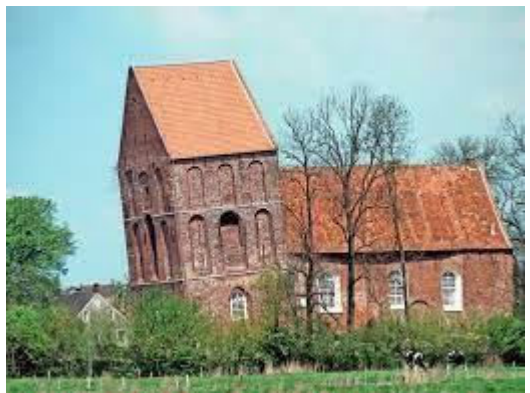
Scheve toren van Suurhusen