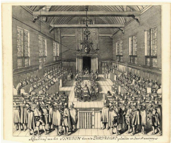
Overzicht van de Dordtse Synode in 1618