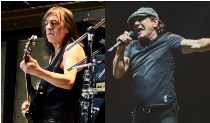
Malcolm Young en Brian Johnson (AC/DC)

Toen Amerikaanse troepen eind 1989 Panama binnenvielen om president Manuel Noriega te arresteren, vluchtte die naar de ambassade van het Vaticaan. De Amerikanen kregen hem naar buiten door continu luide muziek van o.a. AC/DC te draaien. Na tien dagen gaf de oud-CIA-agent zich 'vrijwillig' over.