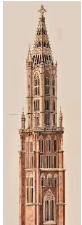
tekening 50 m hoge torenspits