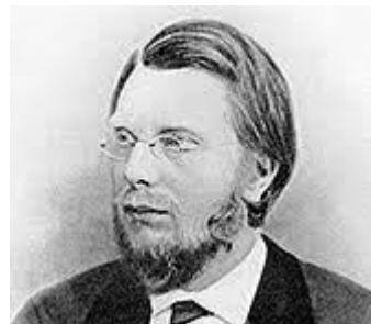
Prins Alexander (1851-1884)