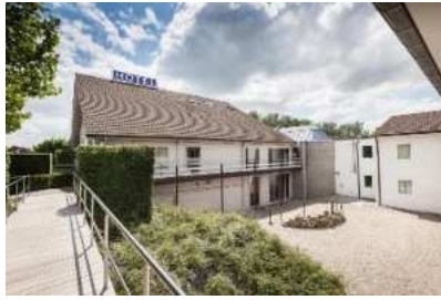
Hotel In Flanders Lodge