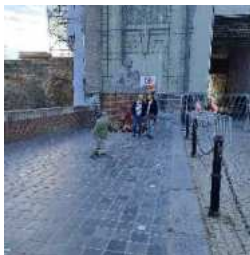
Monument voor de kranslegging