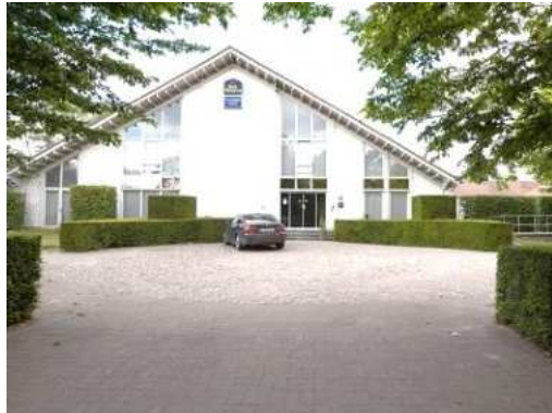
Hotel In Flanders Lodge

Het plan was om vanuit het hotel naar Ieper te lopen, om daar de Last Post Ceremonie bij te wonen. Lopen was echter geen optie, het ontbreken van een normaal wandelpad in combinatie met de afstand deed ons besluiten om met de auto naar Ieper te gaan.