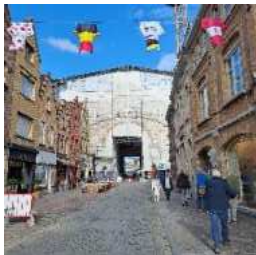
Menenpoort in de steigers

Het plan was om vanuit het hotel naar Ieper te lopen, om daar de Last Post Ceremonie bij te wonen. Lopen was echter geen optie, het ontbreken van een normaal wandelpad in combinatie met de afstand deed ons besluiten om met de auto naar Ieper te gaan.