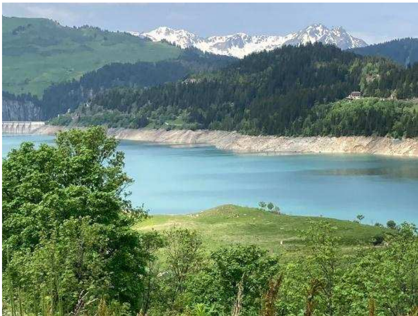
Lac de Roselend (1600m)

Zo schrijf je een voorwoord over de gedachten om op vakantie te gaan en zo schrijf een voorwoord nadat je weer terug bent gekomen van die vakantie. Genoten hebben we zeker.