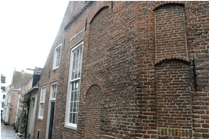
Dichtgemetselde vensters in de Kersteeg.

Daarnaast werden ruiten dichtgemetseld om voor dat raam helemaal geen belasting te betalen. Kijk maar eens naar het onderstaande pand aan de Kersteeg. Hier zie je nog precies waar eerst een raam zat.