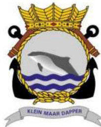
Embleem Zr.Ms. Bruinvis

De Zr.Ms. Bruinvis is een Nederlandse onderzeeboot van de Walrusklasse, gebouwd door de Rotterdamse scheepswerf RDM. De bouw van de Bruinvis liep vertraging op doordat een deel van de voor de Bruinvis bedoelde apparatuur voor de uitgebrande onderzeeboot Walrus werd gebruikt. Al eerder is bij de Nederlandse marine een schip naar de bruinvis genoemd, de Hr.Ms. Bruinvisch uit 1941.