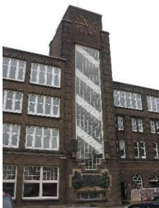
Voormalig directiekantoor aan de kade in Heijplaat

Voor de huisvesting van de medewerkers liet de RDM vanwege de nogal afgelegen ligging van het bedrijf een eigen dorp bouwen, dat tussen 1914 en 1918 verrees en Tuindorp Heijplaat werd genoemd. Dat dorp omvatte ook scholen, drie kerken, een bejaardenhuis en winkels. Er vormde zich een hechte dorpsgemeenschap, die zich - met succes - hevig roerde tegen een dreigende sloop van het complex begin jaren negentig.