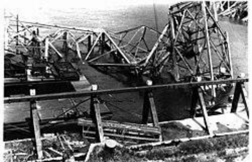
Verwoeste haveninstallaties in 1945

In september 1944, na de start van de Operation Market Garden , besloten de bezetters alle grotere Nederlandse havens, haveninstallaties en alle grote bruggen te vernietigen, terwijl alle