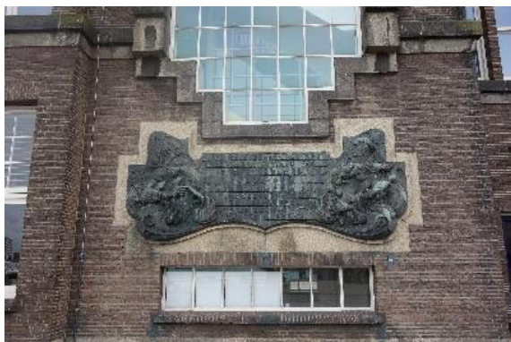
Reliëf bij 50-jarig bestaan

Onder druk van de opkomst van Japan als scheepsbouwland verschoof de RDM halverwege de jaren 1960 richting marine en offshore . Het bouwde daarbij een sterke positie in de gespecialiseerde apparatenbouw. In opstartende offshore was Brown & Root aanvankelijk de dominerende partij en die liet bij de RDM enkele schepen bouwen. In 1965 werd het kraanponton Atlas gebouwd, het jaar daarop gevolgd door de pijpenlegger Hugh W. Gordon en in 1967 het kraanponton Hercules en de sleuvengraver BAR 279 . In 1976 werd de grootste pijpenlegger tot dan toe opgeleverd, de superbarge BAR 347 .