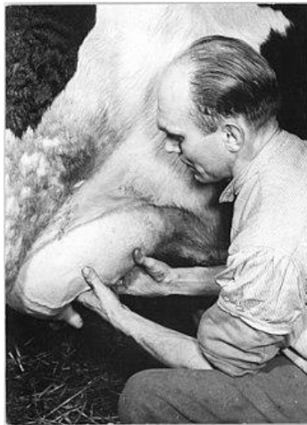
Een koeienier wordt onderzocht

Uierboord wordt gesneden uit de uier van een geslachte koe. Het was tot ongeveer 1950 volksvoedsel. Vele jaren later is het een gerecht dat in sommige plaatsen beschouwd wordt als een delicatessen. Een geschikte uier is afkomstig van een tot de slacht melkgevend koe. Hij mag geen kruisings hebben en niet met geneesmiddelen behandeld zijn.